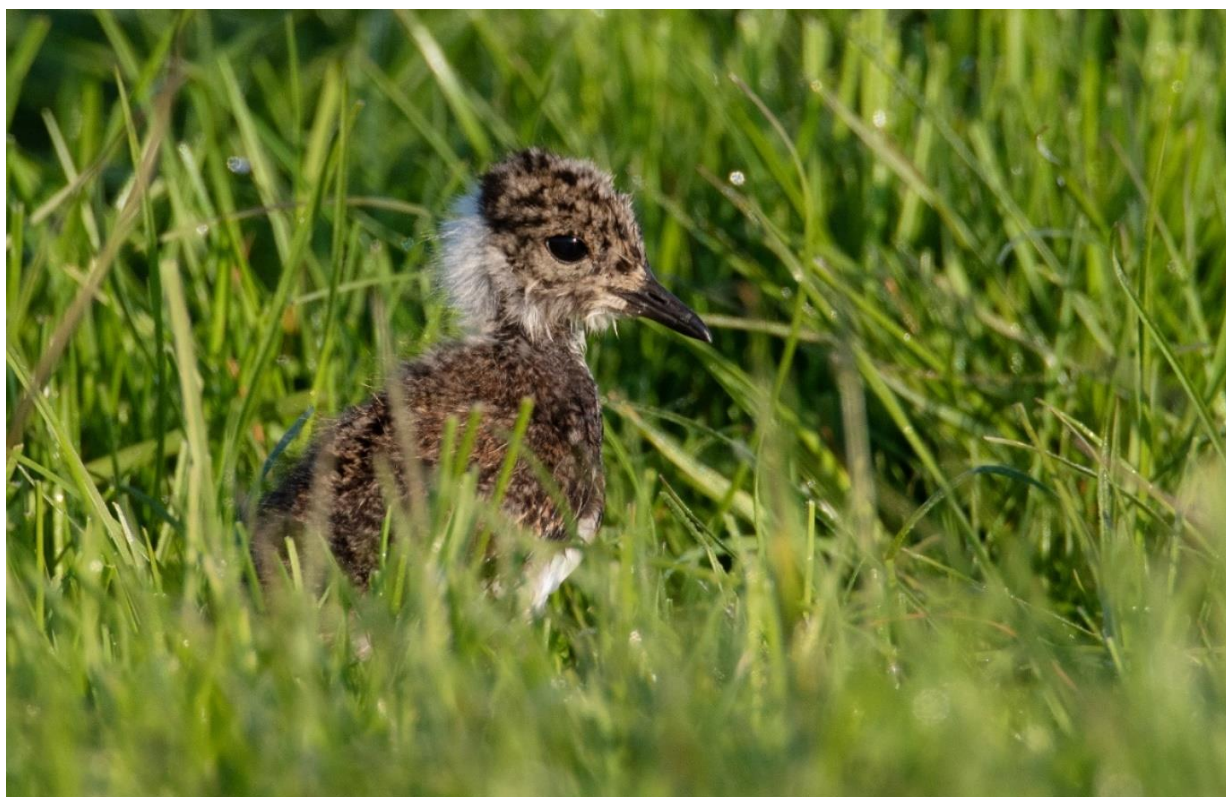
Jonge Kievit in grasland