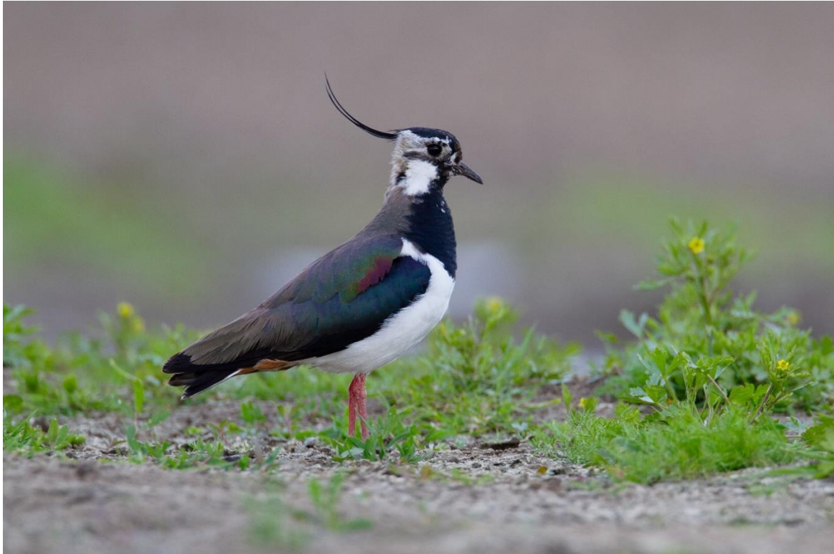
Kievit op braak bouwland