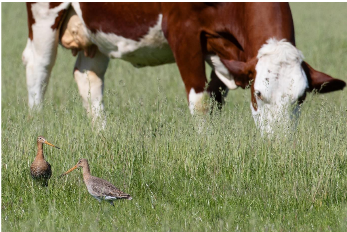
Een paartje grutto's in extensief beweid grasland

Extensief weiden zorgt ervoor dat de vegetatie gevarieerder, minder open en minder egaal is dan de percelen die gemaaid worden. Dit beheerpakket is daardoor een mooie toevoeging in een beheermozaïek voor weidevogels. Een intensieve beweiding geeft een te grote kans op vertrapping van nesten en het gras wordt snel kort gegeten. Door te weiden met minder vee, ontstaat er structuurrijk grasland met ruimte voor schuilmogelijkheden. Ook trekken de mestflatten van het vee insecten aan die als voedsel dienen voor volwassen weidevogels en wat oudere kuikens.