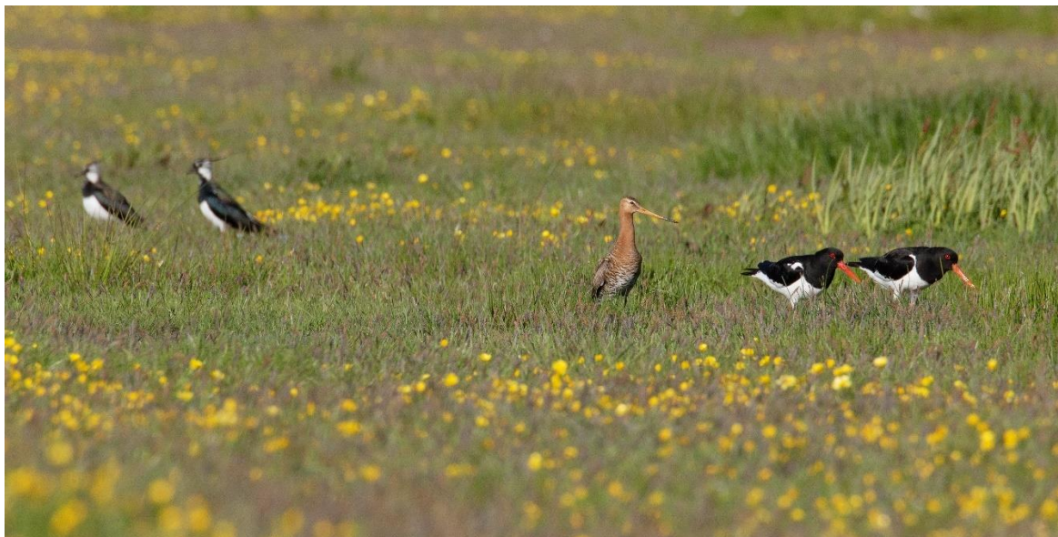
Gedurende de rustperiode zijn beweiding en bewerkingen niet toegestaan