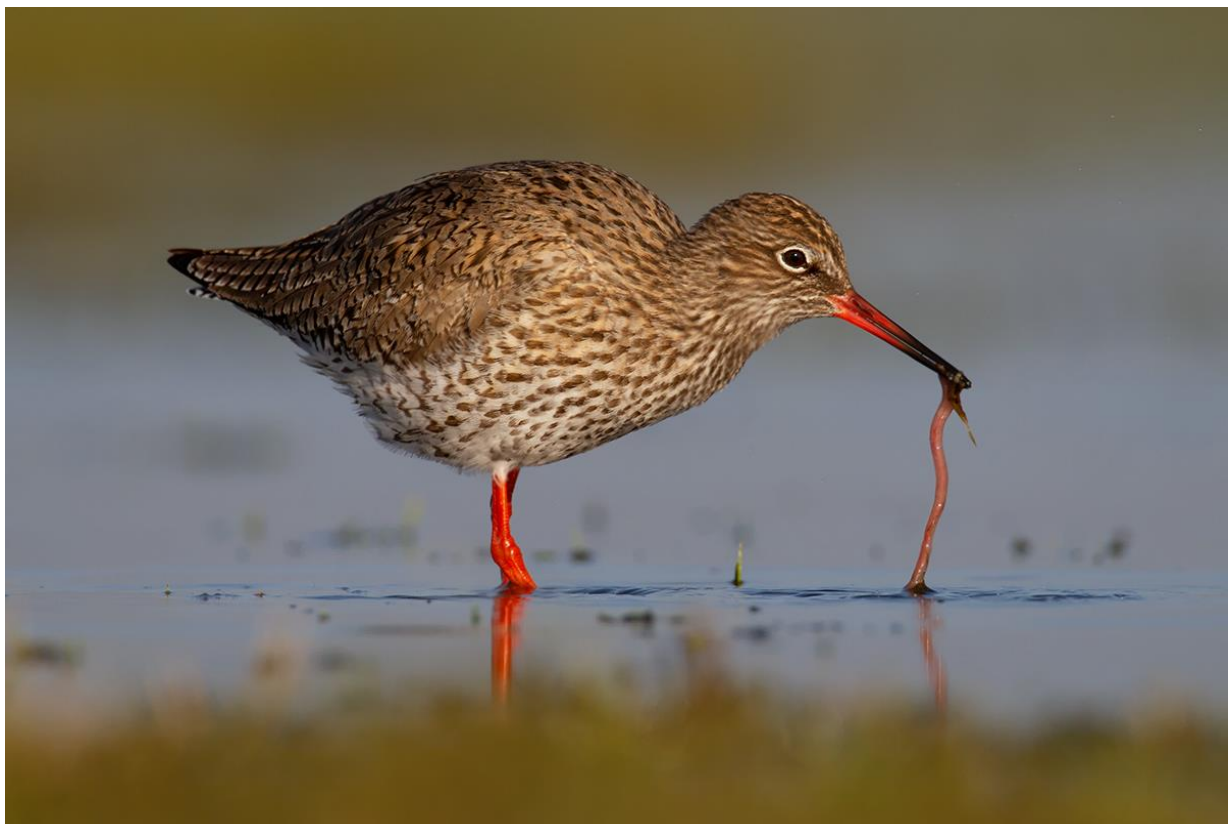
Tureluur met worm in plasdras