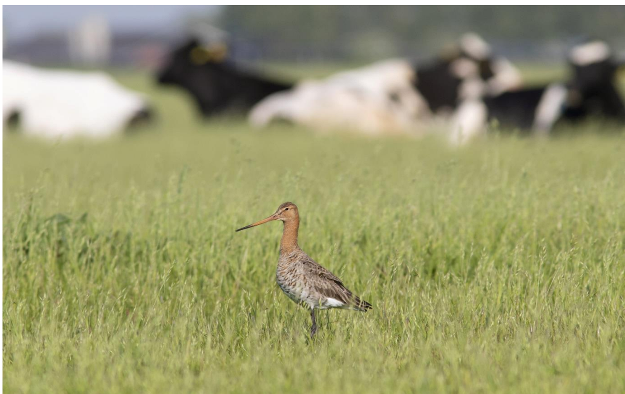
Grutto in grasland met koeien