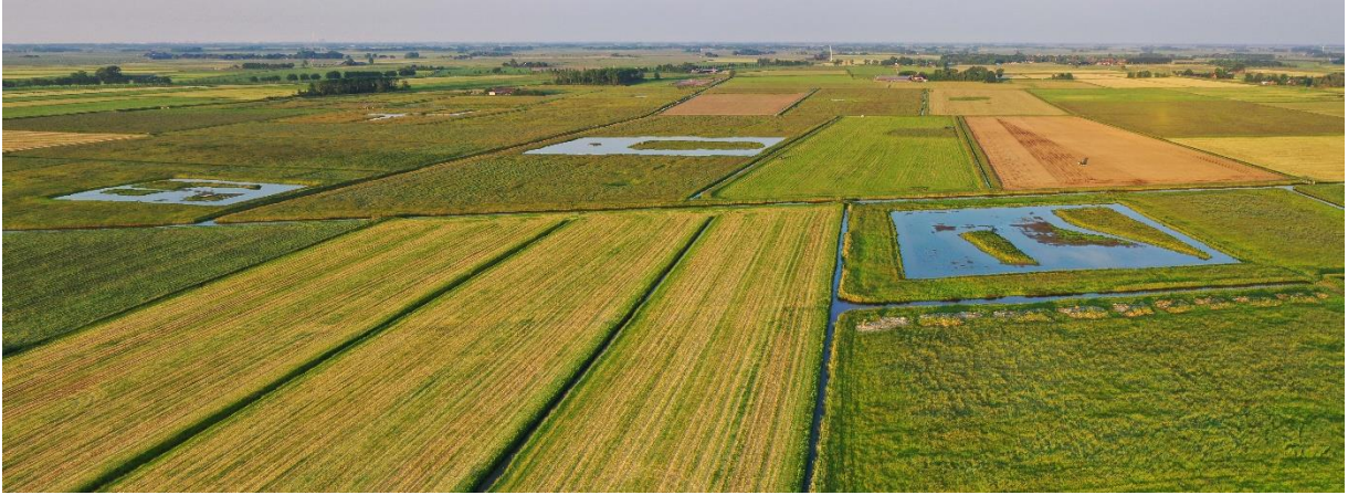
Mozaïekbeheer bij Tinallinge

Let op: BoerenNatuur Groningen West heeft een plafond ingesteld van € 180.000,- per jaar. Mocht blijken dat er te veel is aangevraagd, dan wordt het hectare-bedrag naar beneden bijgesteld.