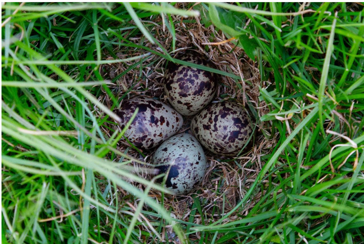
Nest van een tureluur in grasland