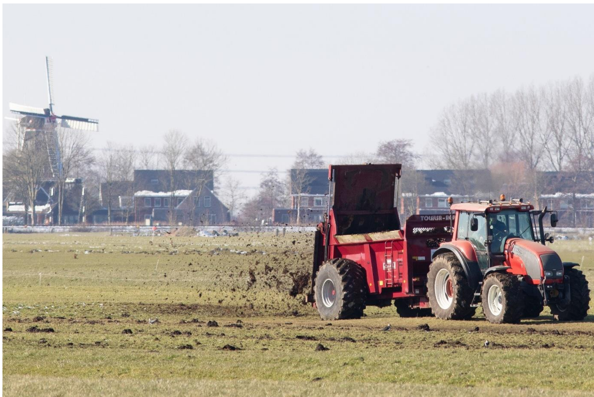
Ruige mest zorgt voor een rijk bodemleven met insecten en wormen voor weidevogels

Het uitrijden van ruige mest is gunstig in een totaalaanpak voor weidevogelbeheer. Het bevordert een 'rustige' grasgroei, waardoor het gewas minder vol wordt en geschikt voor kuikens. Ook zorgt ruige mest voor meer structuur in het gewas en biedt het meer ruimte voor kruiden. De organische mest zorgt bovendien voor een rijk bodemleven waarop oudervogels kunnen foerageren. Tenslotte wordt het stro in de ruige mest door sommige vogels (met name kieviten) ook gebruikt als nestmateriaal.