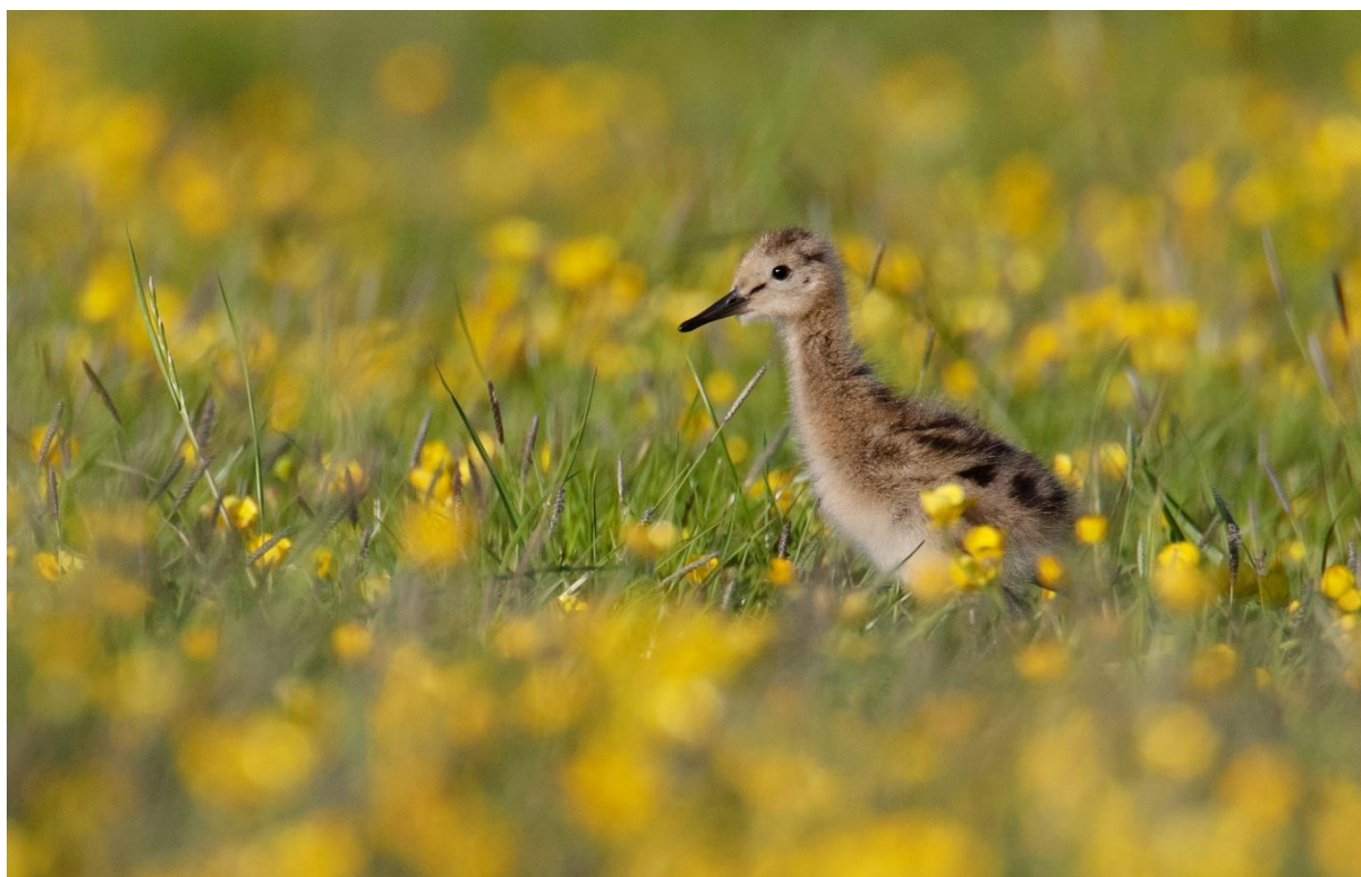
Jonge grutto in kruidenrijk grasland