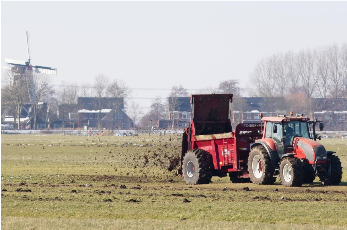
Ruige mest zorgt voor een rijk bodemleven met insecten en wormen voor weidevogels

Het uitrijden van ruige mest is gunstig in een totaalaanpak voor weidevogelbeheer. Het bevordert een 'rustige' grasgroei, waardoor het gewas minder vol wordt en geschikt voor kuikens. Ook zorgt ruige mest voor meer structuur in het gewas en biedt het meer ruimte voor kruiden. De organische mest zorgt bovendien voor een rijk bodemleven waarop oudervogels kunnen foerageren. Tenslotte wordt het stro in de ruige mest door sommige vogels (met name kieviten) ook gebruikt als nestmateriaal.